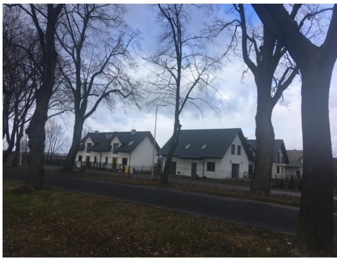
Zabudowa mieszkaniowa jednorodzinna przy ul. Dworcowej w sąsiedztwie planu