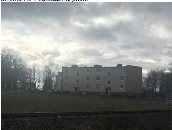
Tereny zabudowy mieszkaniowej wielorodzinnej w sąsiedztwie planu