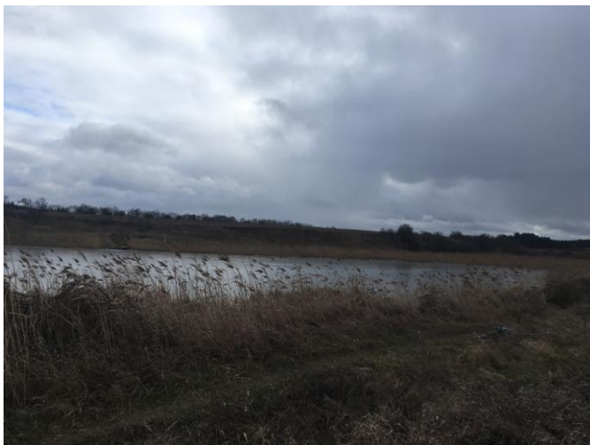
Jezioro Szreniawskie w obrębie planu