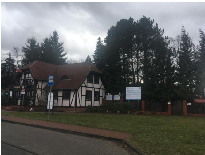
Muzeum Rolnictwa i Przetwórstwa Rolno-Spożywczego w Szreniawie w sąsiedztwie planu