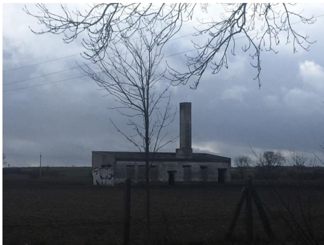
Zabudowania gospodarcze w obrębie planu